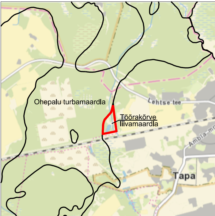
Kaardileht nr 6431 Tapa